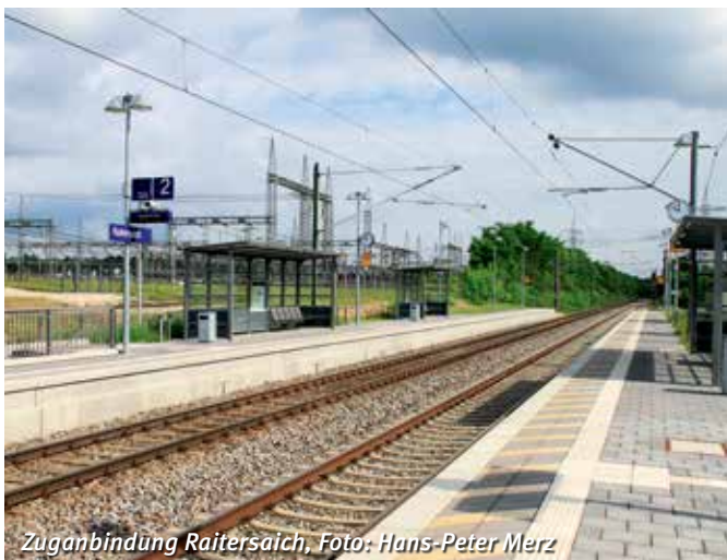
Zuganbindung Raitersaich

Mo: 15.00 – 21.00 Uhr Di: 13.00 – 21.00 Uhr (KidsTime offener Treff für alle zwischen 8 und 14 Jahren) Mi: 15.00 – 21.00 Uhr Fr: 15.00 – 22.00 Uhr