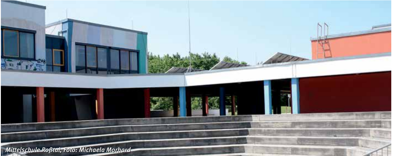
Mittelschule Roßtal