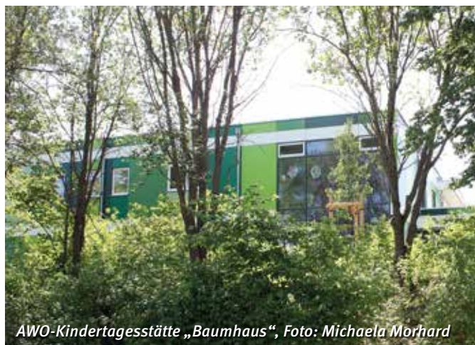
AWO-Kindertagesstätte „Baumhaus“