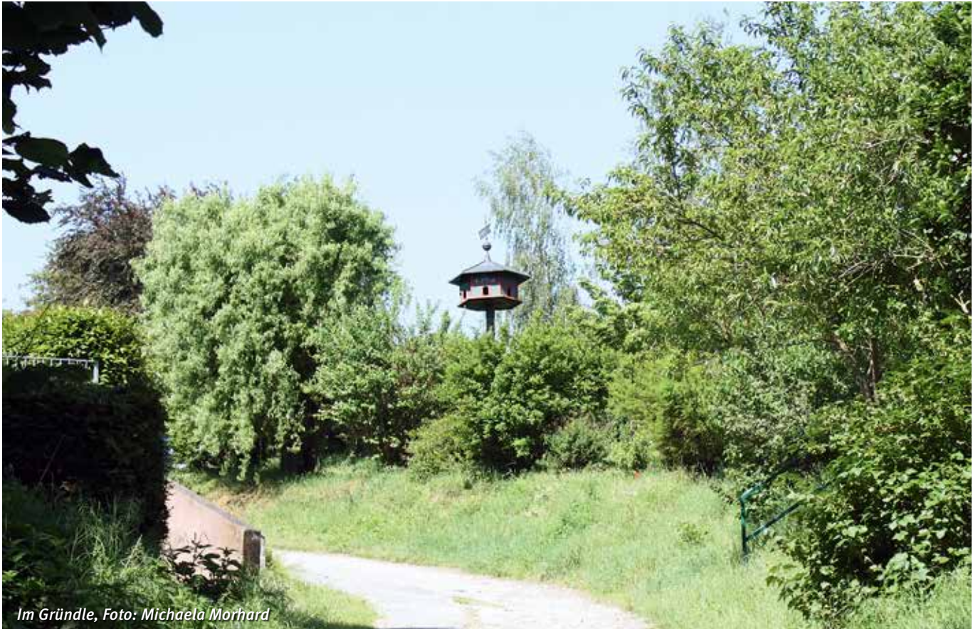
Im Gründle