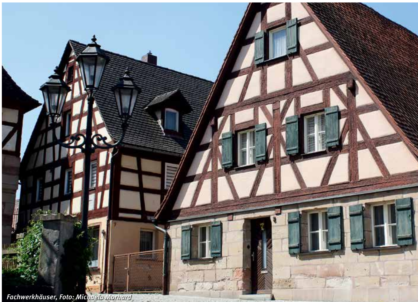
Fachwerkhäuser, Foto: Michaela Morhard