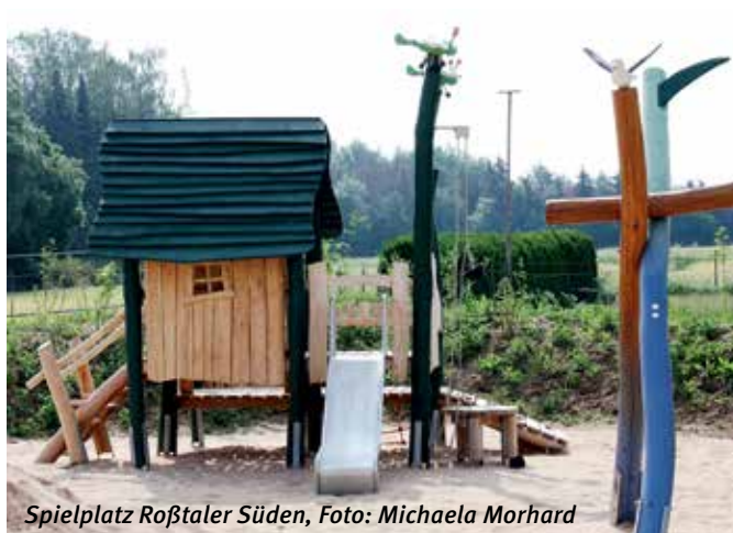
Spielplatz Roßtaler Süden, Foto: Michaela Morhard

Mo – Fr: 11.15 Uhr bis wahlweise 14.30 Uhr oder 16.00 Uhr