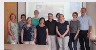
Fairtrade-Steuerungsgruppe des Landkreis Fürth